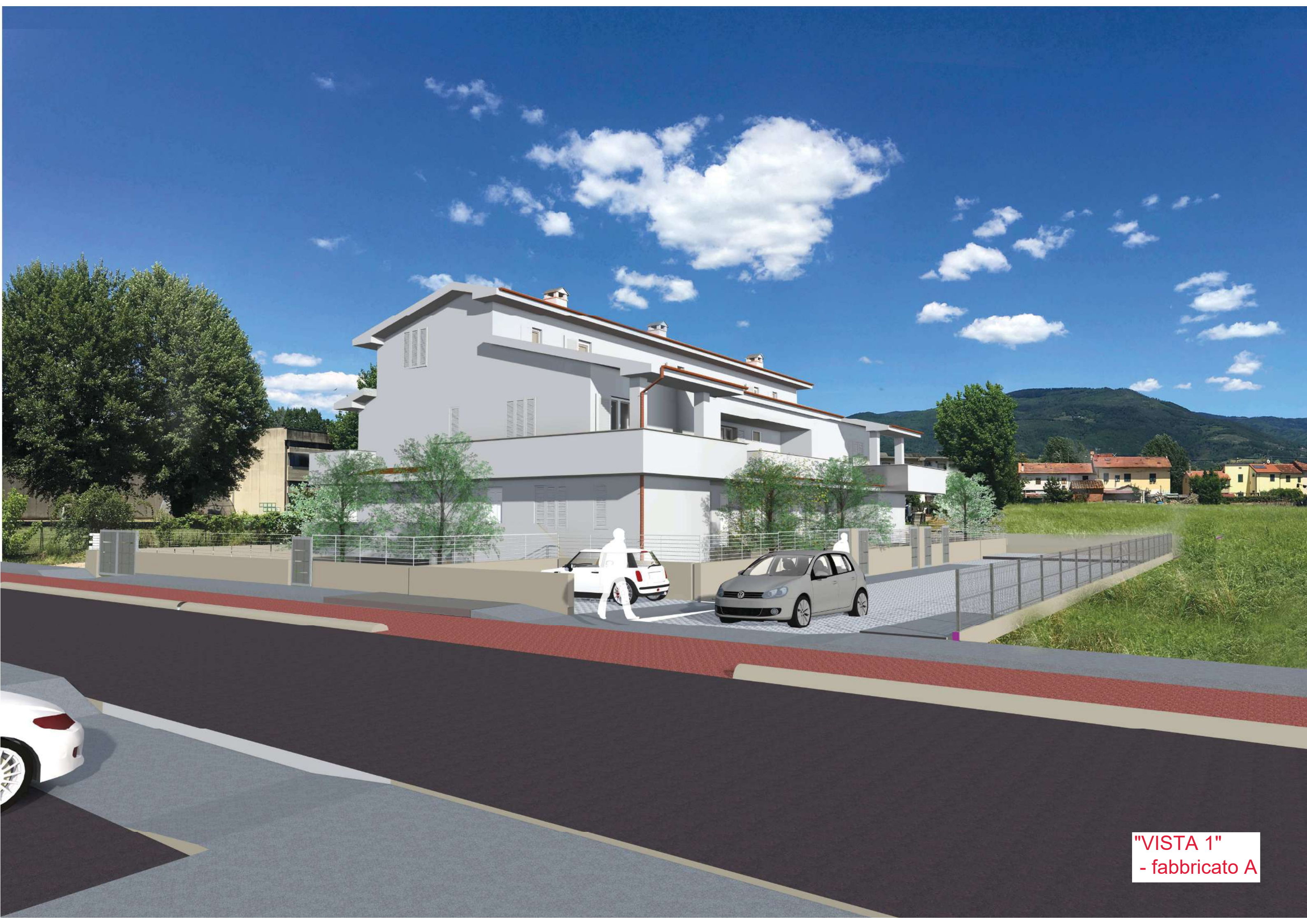
"VISTA 1" - fabbricato A