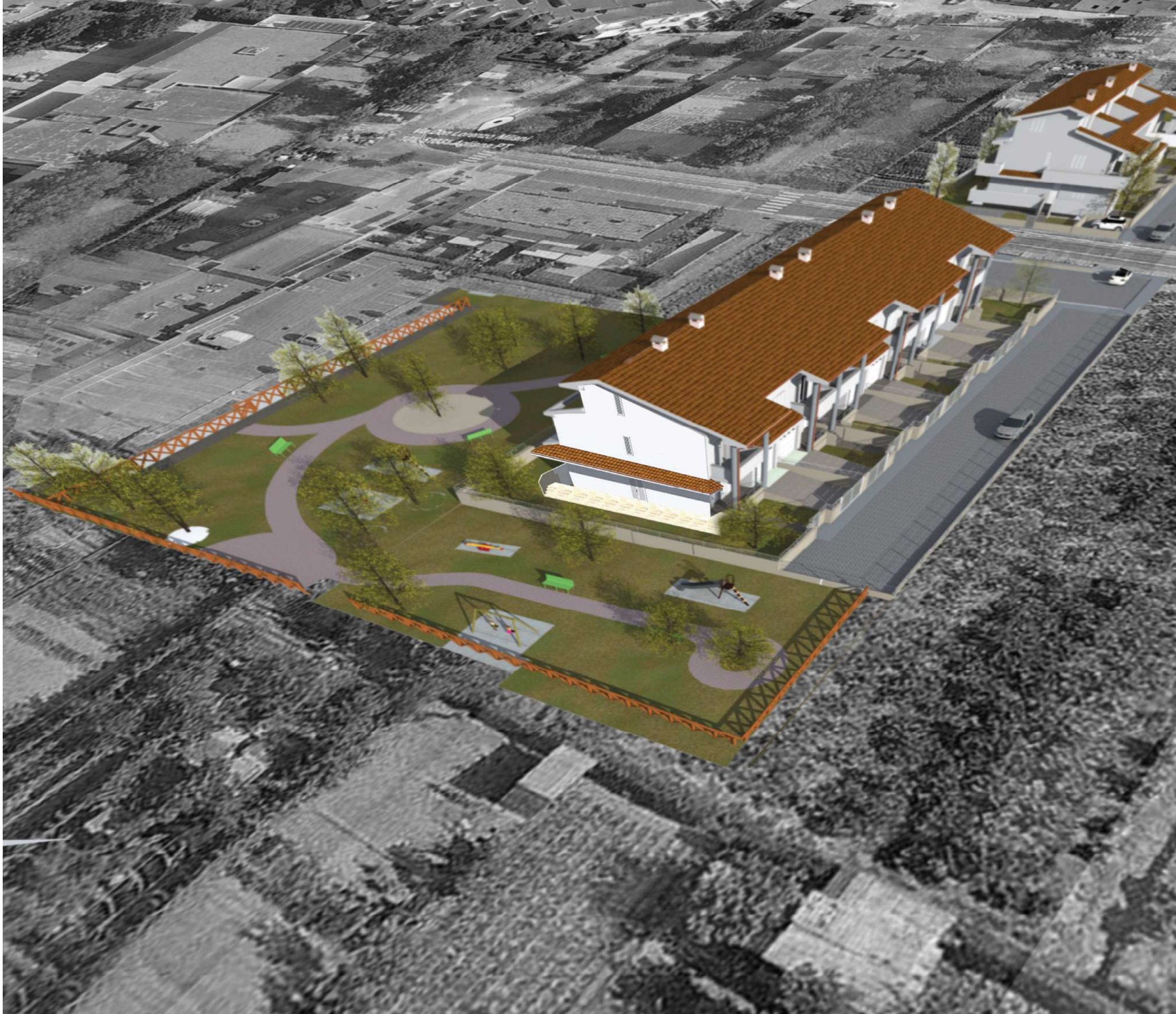
"VISTA 4" - fotoinserimento vista aerea