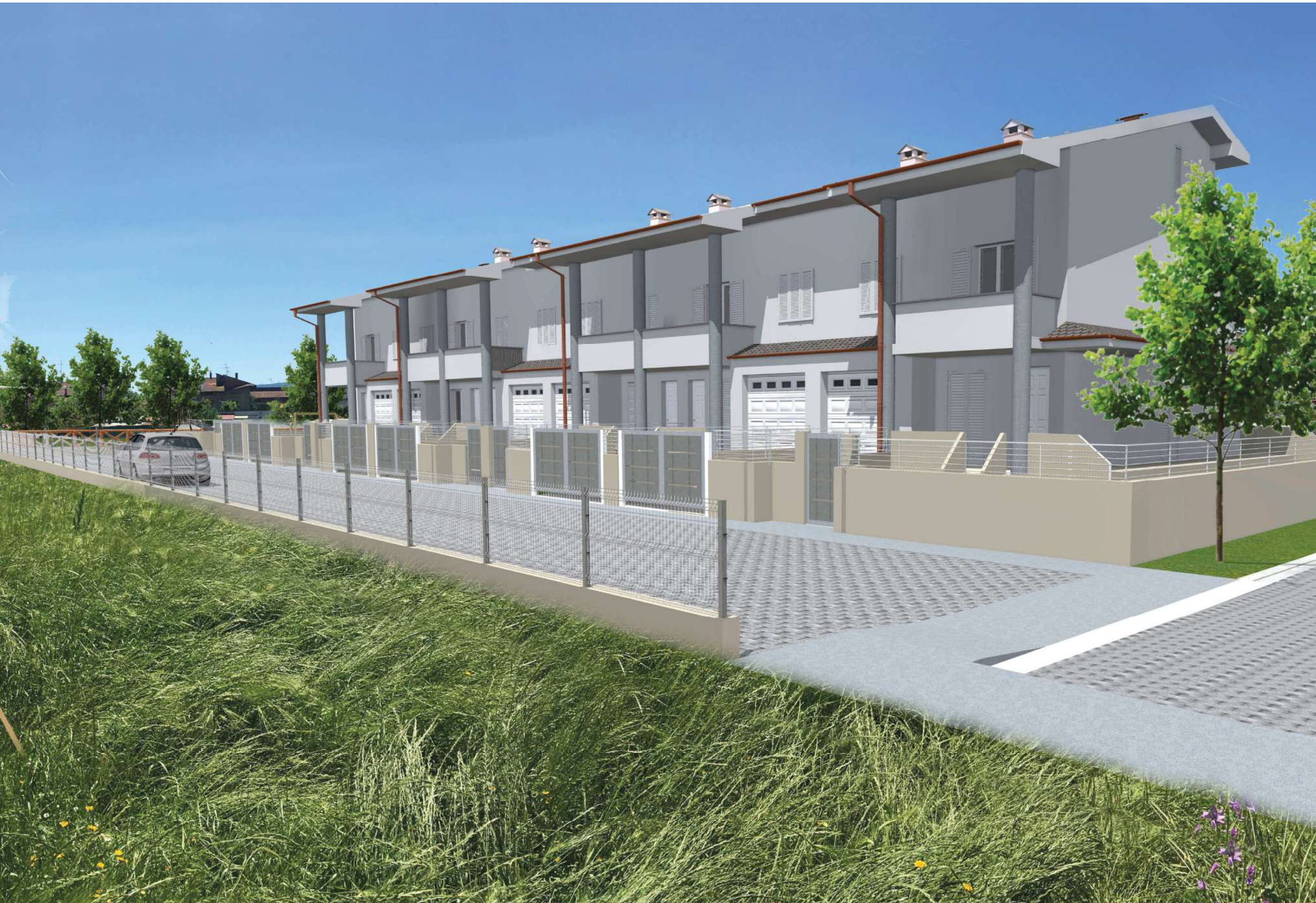
"VISTA 2" - parcheggio pubblico - fabbricato B