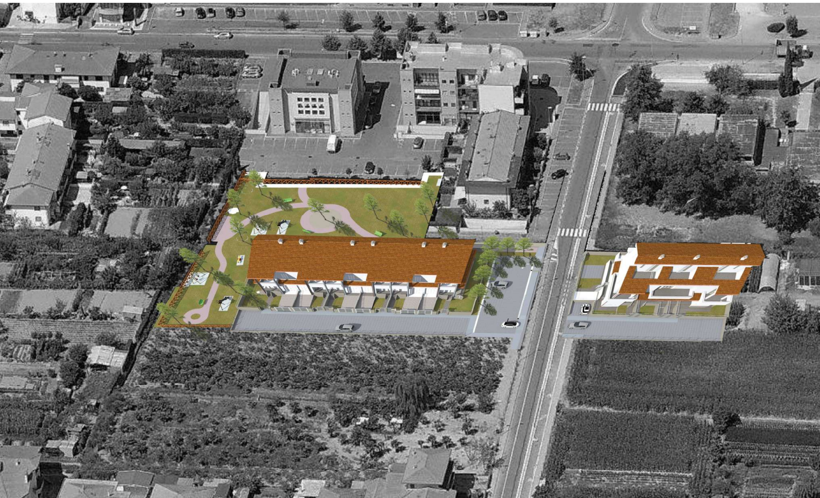
"VISTA 3" - fotoinserimento vista aerea